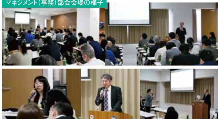
マネジメント(事務)部会会場の様子

理学療法士等による訪問看護について、週4日目以降の評価を見直す。また訪問看護計画書および訪問看護報告書について、訪問する職種または訪問した職種の記載を要件とする。